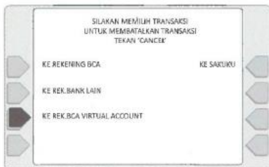
3. Pilih menu REK BCA VIRTUAL ACCOUNT