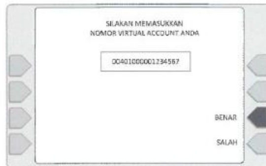
4. Masukkan No. Virtual Account BCA: Non-Syariah : 00401+00+No. Polis atau 00401+II+No PPAJ Syariah : 01465+00+No. Polis atau 01465+II+No PPAJ