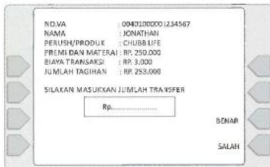
5. Muncul tampilan di layar seperti di atas