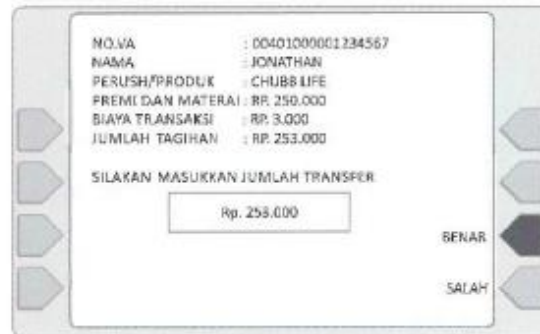
6. Masukkan jumlah premi yang tertera dan tekan BENAR