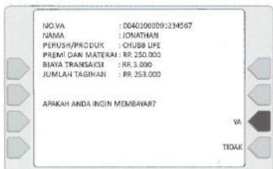
7. Cek no PPAJ/No.Polis yang diinput dan cek jumlah pembayaran. Jika sudah benar pilih YA .