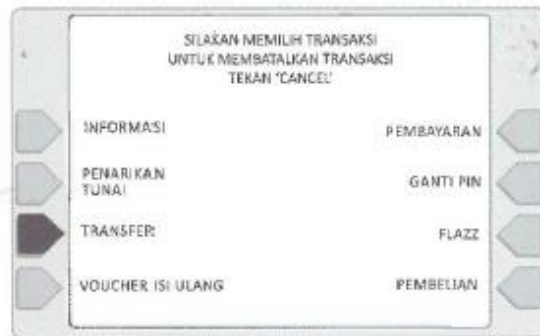
2. Pilih menu TRANSFER