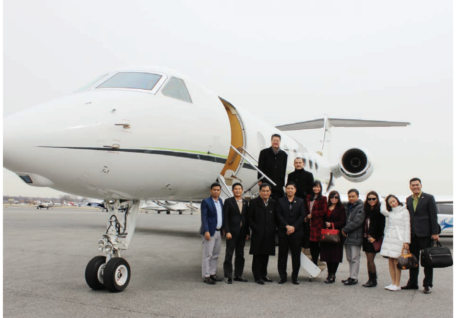
Sẵn sàng trước một chuyến đi với nhiều trải nghiệm tuyệt vời.