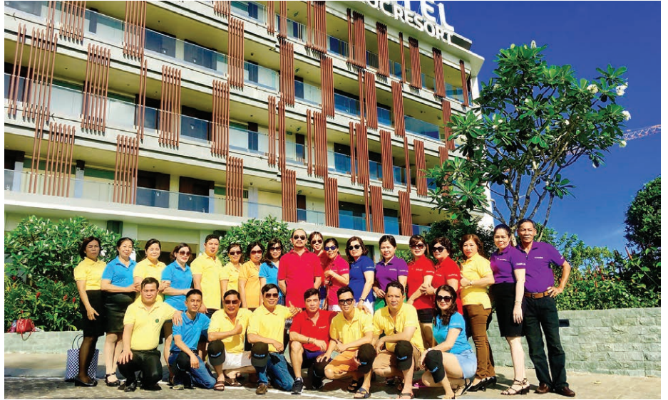
Hội nghị Bàn tròn Triệu đô 2017 là dịp để vinh danh 27 thành viên xuất sắc vừa đạt danh hiệu MDRT trước hạn của năm 2018.

Trong suốt thời gian diễn ra chương trình, các MDRT đã có cơ hội tham dự buổi tiệc chiêu đãi long trọng của Tổng Giám đốc, đồng thời gặp gỡ Ban Giám đốc, Ban Điều hành và Phát